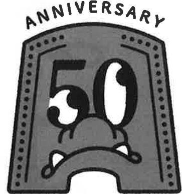
大宰府史跡発掘50年

問 3 古代に置かれた大宰府は、太宰府市の地名の由来ともなりましたが、どんなものだったでしょうか。