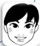
エステティシャン 船橋